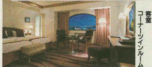
客室 コーナーツインルーム

今回のきんさん新聞で は、身近にある非日常 的なリゾート空間がモ ットーのホテル「ホテル プラザ神戸」をご紹介します。 神戸東部の海上の島、 「六甲アイランド」の中 心部に位置し、三方を海 に囲まれた美しい景観と 静かな環境に恵まれた同 ホテル。神戸の街並みが 一望できるレストランを 始め、宴会場やガーデン チャペルなど様々な設備 を兼ね備えた、都会のリ ゾートで優雅なひと時 を過ごして頂けます。