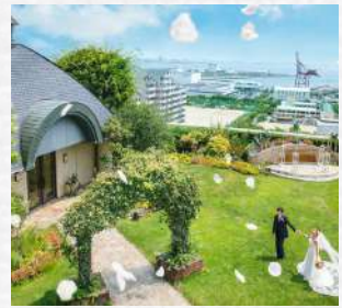
ホテル11階ガーデン 7時～23時まで利用可